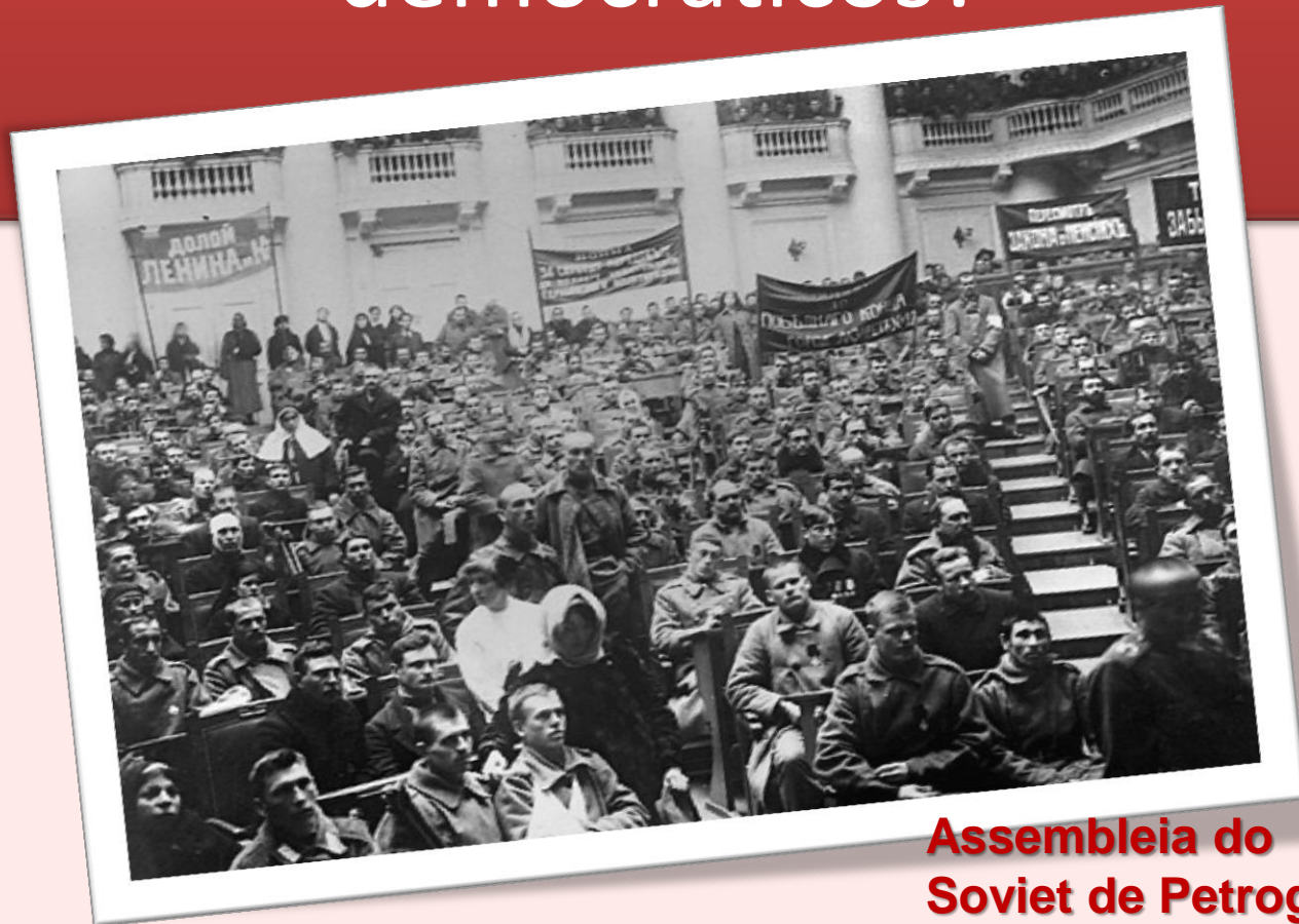
Assembleia do Soviet de Petrogrado

9. Por que os bolcheviques fecharam a Assembleia Constituinte? Por que os Sovietes são mais democráticos?