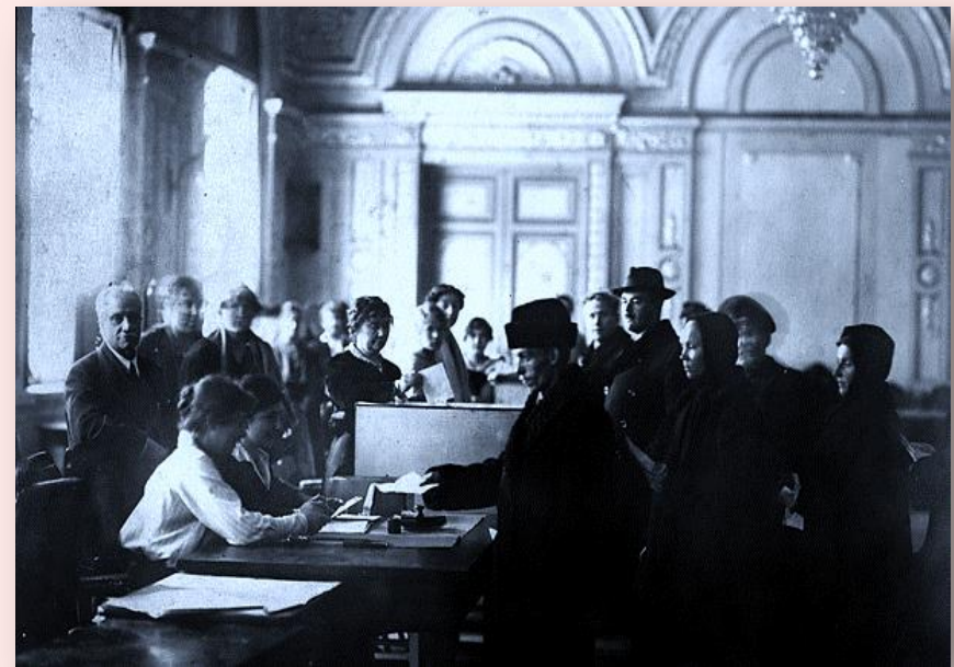
Eleição para Assembleia Constituinte

Por que ela não representava mais os interesses do proletariado e da classe operária, quando da sua posse, e os trabalhadores viram isso.