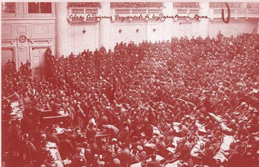
Assembleia do Soviet

São mais eficientes e baratos porque centralizam o poder executivo, legislativo e judiciário.