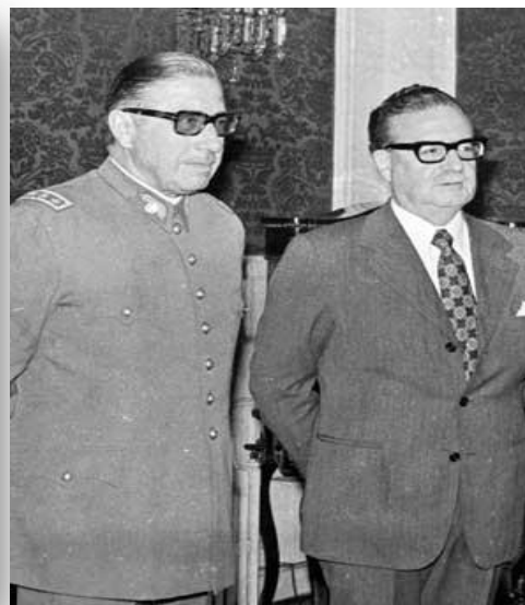
Foto de agosto de 1973 mostra o general chileno Augusto Pinochet (à esquerda) e o presidente Salvador Allende.

Os exemplos na história são vários: Guerra Civil Espanhola, João Goulart, Allende etc.