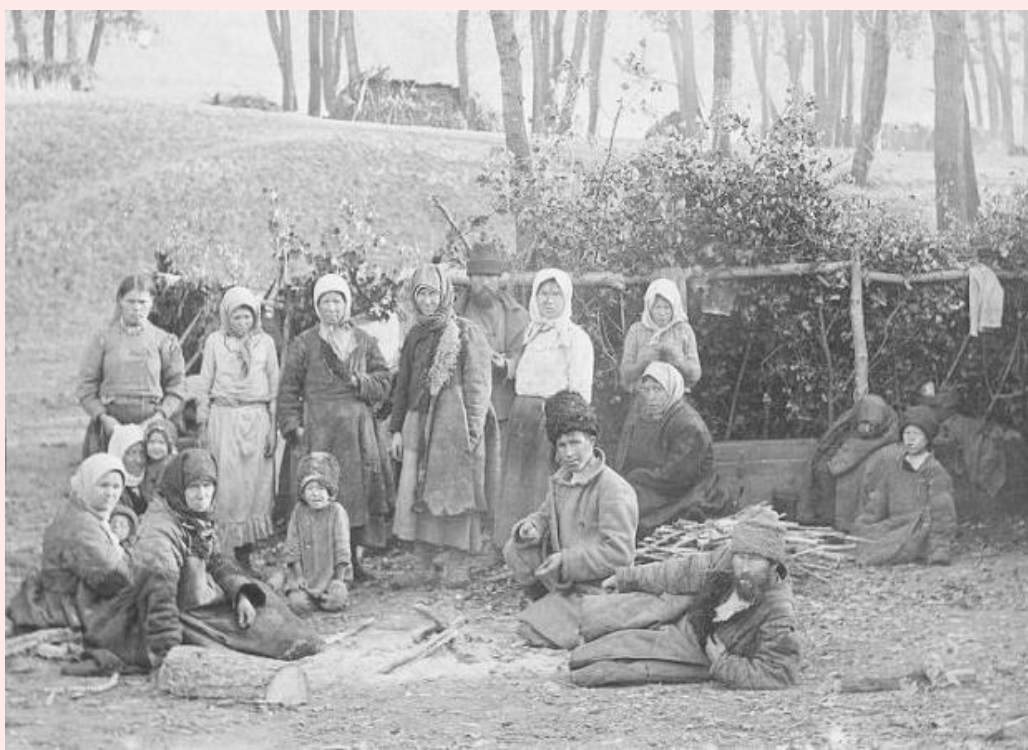
camponeses russos em 1900