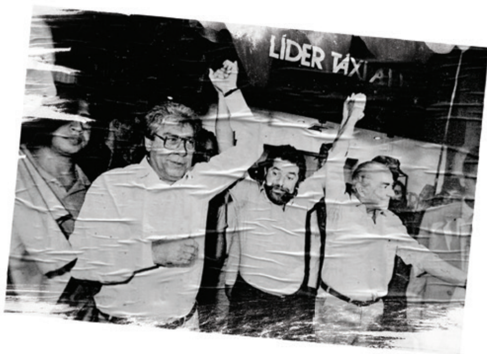
Lula é apoiado por Mário Covas (PSDB) e Leonel Brizola (PDT) no segundo turno das eleições presidenciais de 1989

No entanto, o surgimento de novos partidos de esquerda que repitam e privilegiem a mesma estratégia do PT, longe de ser uma solução, significa aprofundar a crise. Então, que tipo de partido, programa e organização de classe precisamos? Começar este debate para construir um forte partido socialista dos trabalhadores será uma tarefa de milhares de ativistas do movimento sindical e popular.