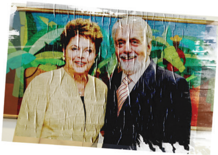
Jacques Wagner é uma figura chave no governo Dilma. Quando jovem, integrou a Organização Sionista no Brasil e, hoje, mantém relações estreitas com líderes israelenses.

A conclusão é evidente: este Estado e este regime político são uma máquina de exploração, opressão e corrupção que não podem ser reformados. A libertação da classe trabalhadora e de todos os setores oprimidos só é possível destruindo este monstro.