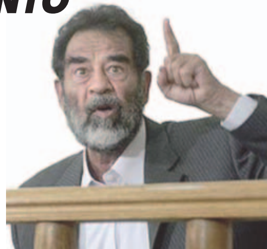
Saddam durante o julgamento

Nesses anos, o imperialismo calou a boca aos crimes de Saddam, como sempre faz em relação aos ditadores que lhe são úteis. Recordemos o que disse Franklin D. Roosevelt, então presidente dos EUA, sobre as atrocidades cometidas por Anastasio Somoza, na Nicarágua: “ ele pode ser um filho da puta, mas é nosso filho da puta ”. Depois da invasão do