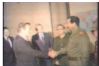
Saddam e Rumsfeld cumprimentam-seno Iraque

Kuwait, em 1990, Saddam deixou de ser um “aliado” e passou a ser um “inimigo”. Por isso, os crimes antes aceitos agora são “condenados”.