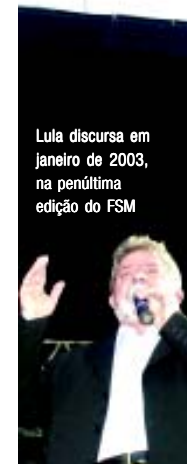
Lula discursando em janeiro de 2003, na penúltima edição do FSM