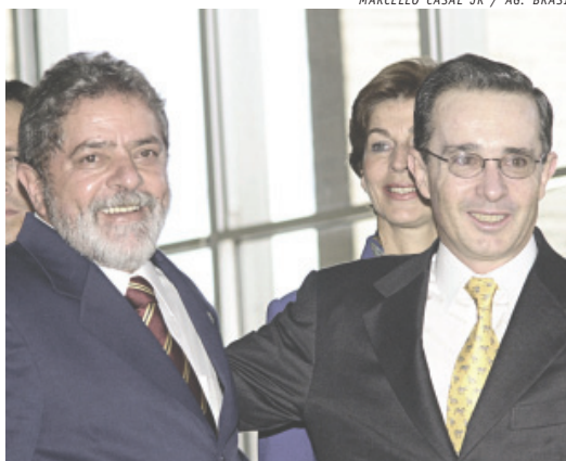
Lula e Álvaro Uribe, presidente da Colômbia: fiéis escudeiros

Assim, os presidentes e os partidos mudam, pela via eleitoral ou derrubados pela luta popular, mas os seus sucessores parecem “clones” dos anteriores. Em matéria de entrega ao imperialismo, são basicamente iguais aos antigos “vice-reis” e